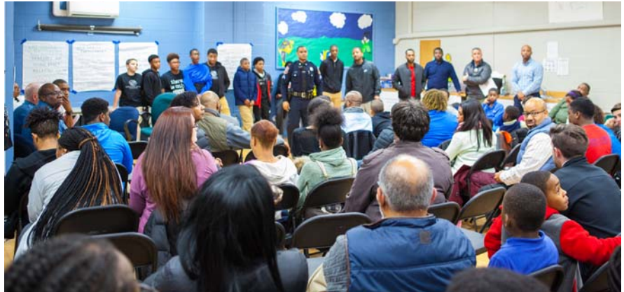
Asesores de JIT y organismos de seguridad interactuando y discutiendo con los participantes comunitarios después de una experiencia de la vida real representada por los miembros del Equipo de Jóvenes de la Calle; organizado y dirigido por los Clubes de Niños y Niñas de Delaware.

En los eventos recientes se ha destacado la necesidad de reunir a los jóvenes y organismos de seguridad para lograr un cambio positivo. Un enfoque consiste en crear oportunidades para reunir a los funcionarios de policía y a los jóvenes con el fin de desarrollar conversaciones bilaterales que promuevan la seguridad y el bienestar de todos los ciudadanos. Un programa nacional denominado Capacitación Justo(Justicia) a Tiempo (Just(ice) in Time Training) constituye un ejemplo de un enfoque para trabajar con las comunidades para atender este problema. Snell & Associates Consultants de Buffalo Grove, Illinois, creó la capacitación de prevención de la violencia: Seminario de